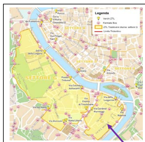
S. Michele a Ripa

Via R. Venuti, 73 00162 Roma Tel. +39.0697605610 fax +39.0697605650 www.fasiweb.com e-mail: aib2011@fasiweb.com