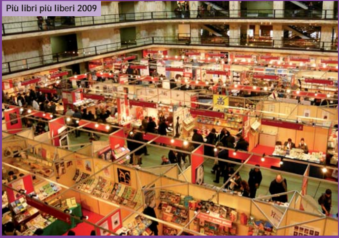
Più libri più liberi 2009