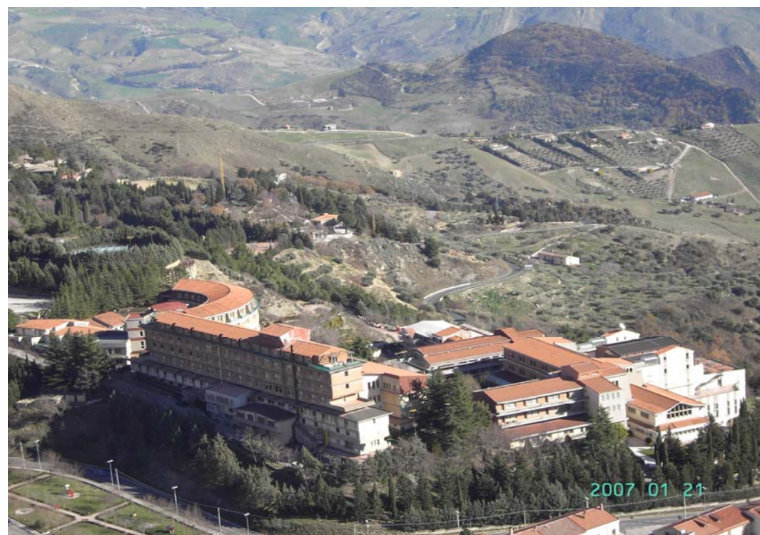
Dipart. Involuzione Cerebrale Centro del Sonno