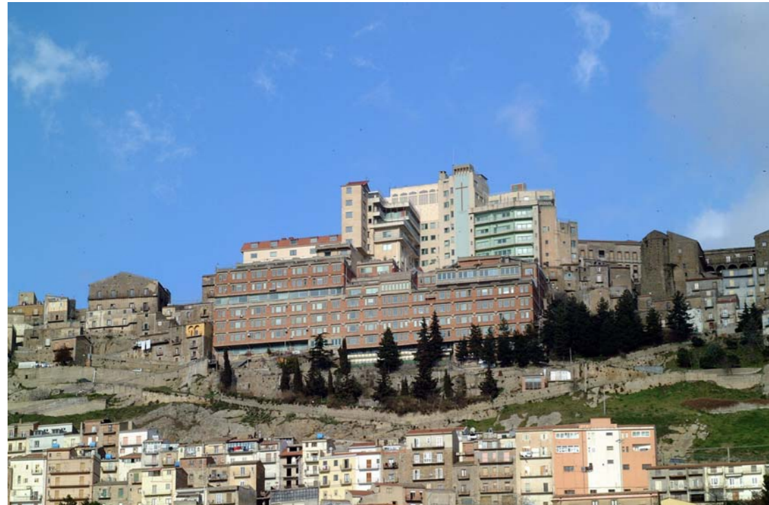
DOMUS MARIAE - Dipart. Ritardo Mentale Lab. di ricerca - Uffici Amministrativi