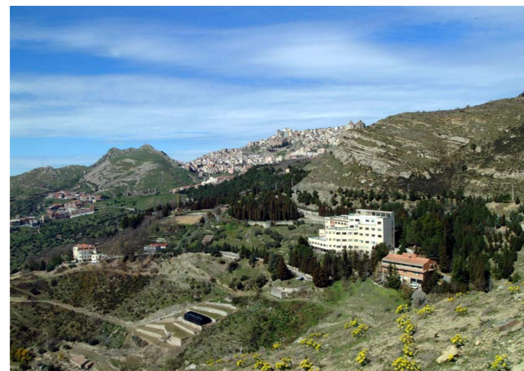
Neuroriabilitazione Centro anziani