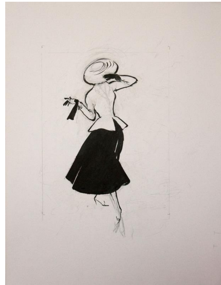
Gruau e Dior Dior, Modello bar, 1947 Gruau, Miss Dior, profumo, 1948