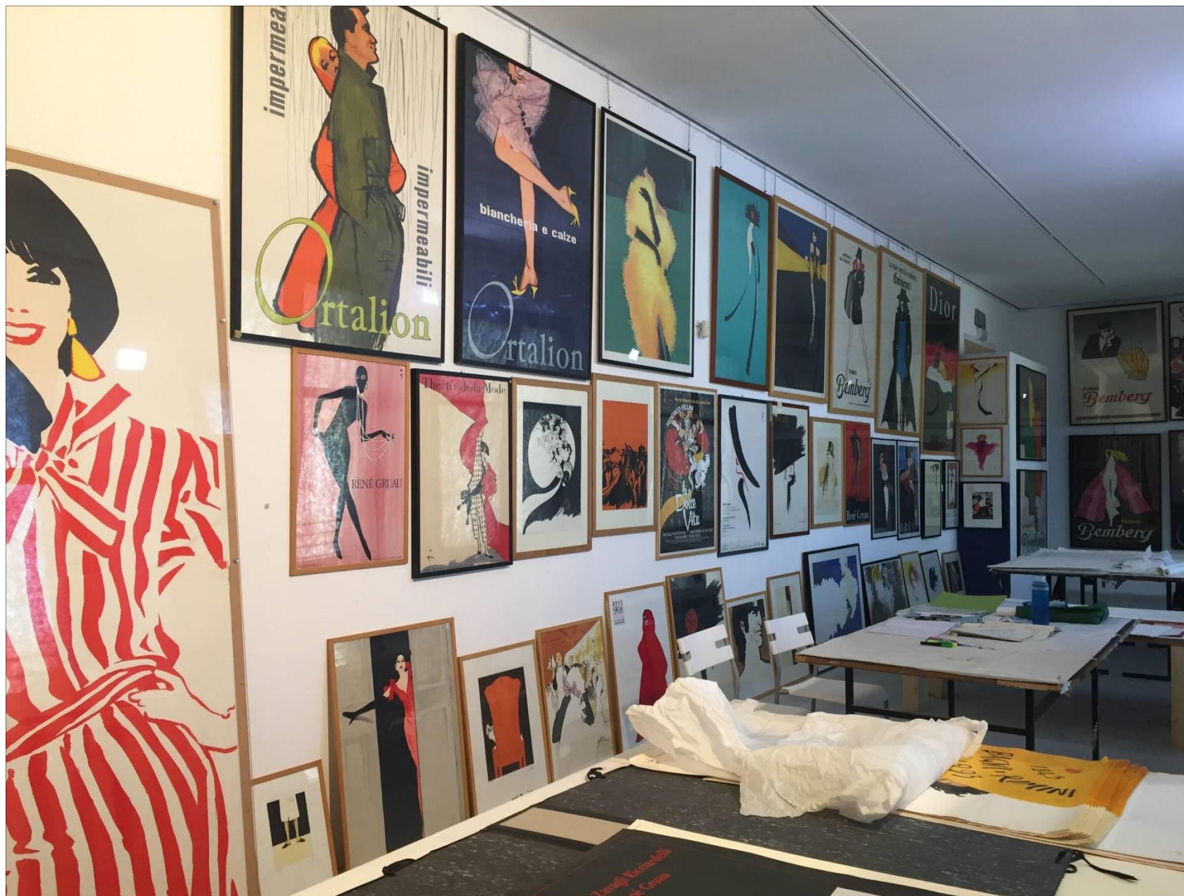
Archivio Gruau, Musei Comunali, Rimini